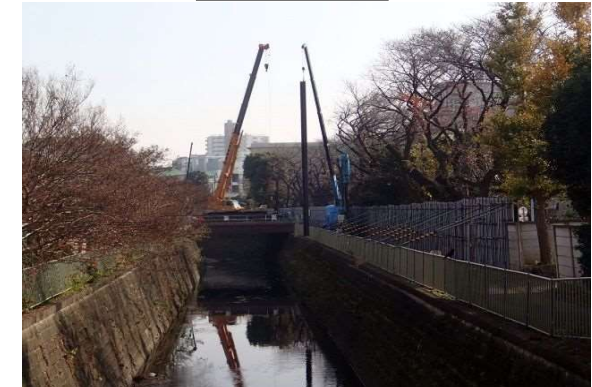
かなな橋より望む