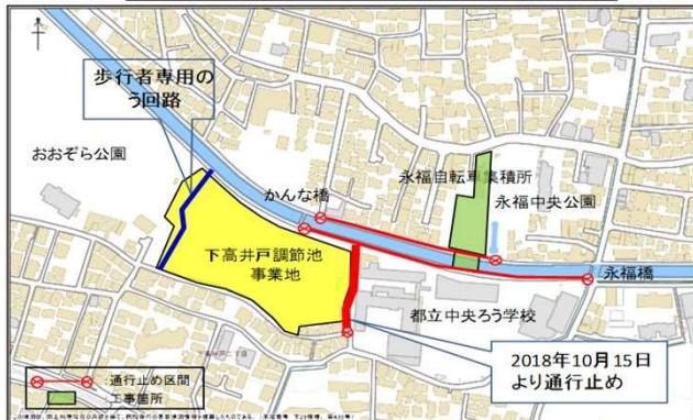
永福橋付近での作業