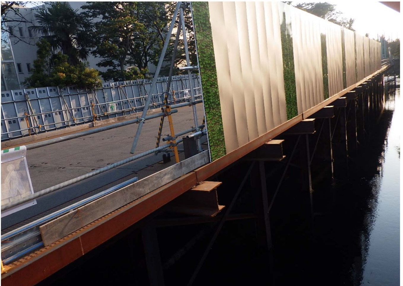
かな橋側：栈橋設置、護岸撤去工 80m完了