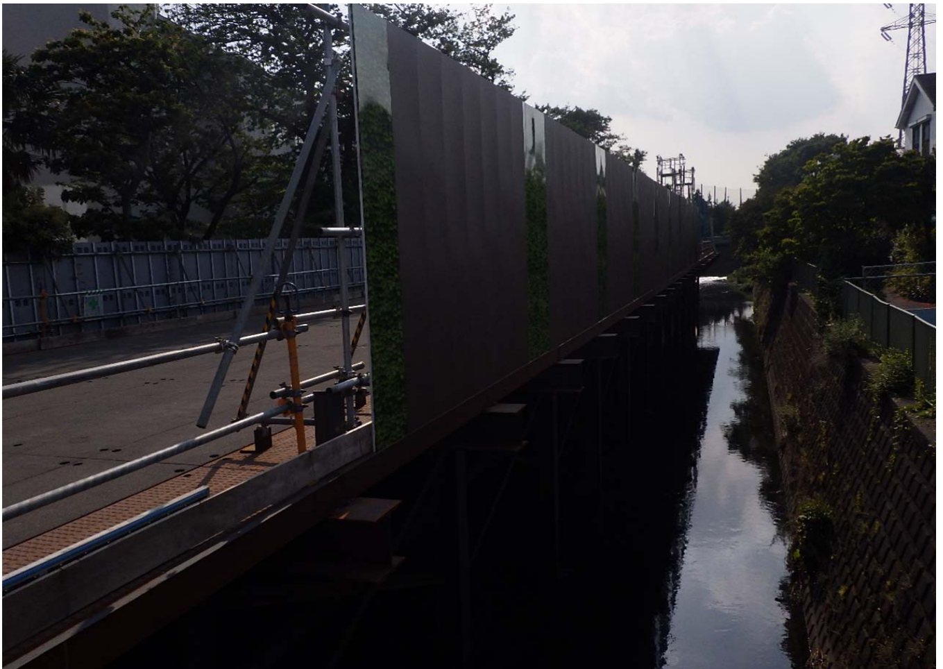
かな橋側：栈橋設置、護岸撤去工 75m完了