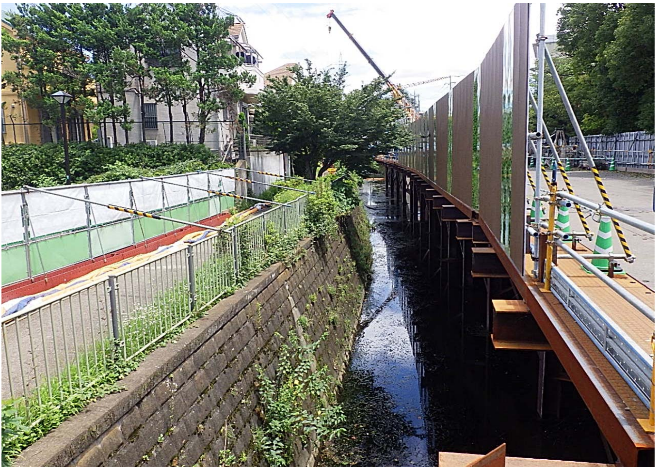
永福橋側：栈橋設置・護岸撤去工 85m完了