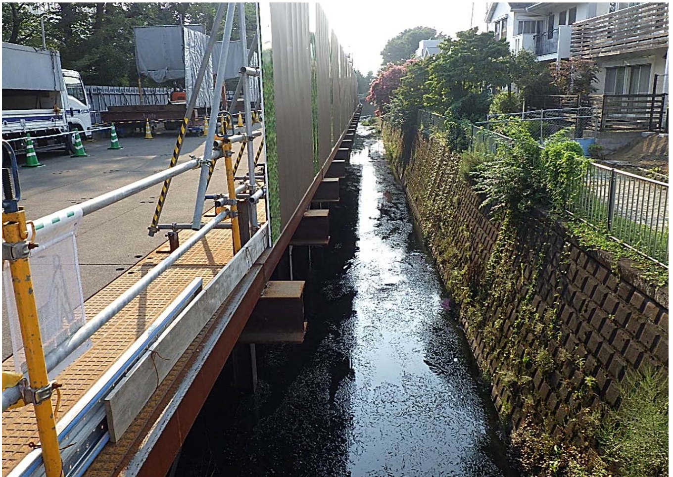
かな橋側：栈橋設置・護岸撤去工 85m完了