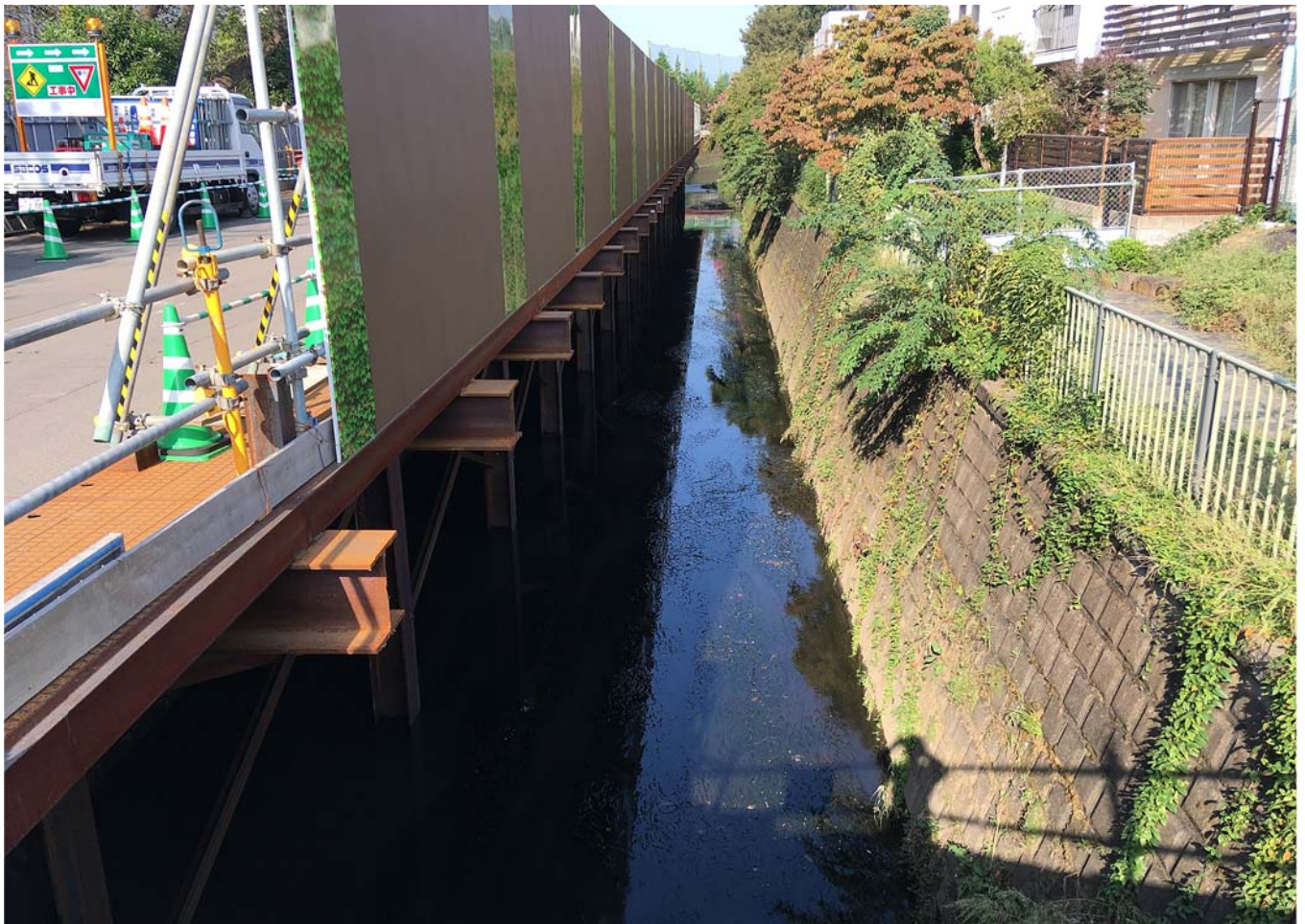
かな橋側：栈橋設置・護岸撤去工 完了