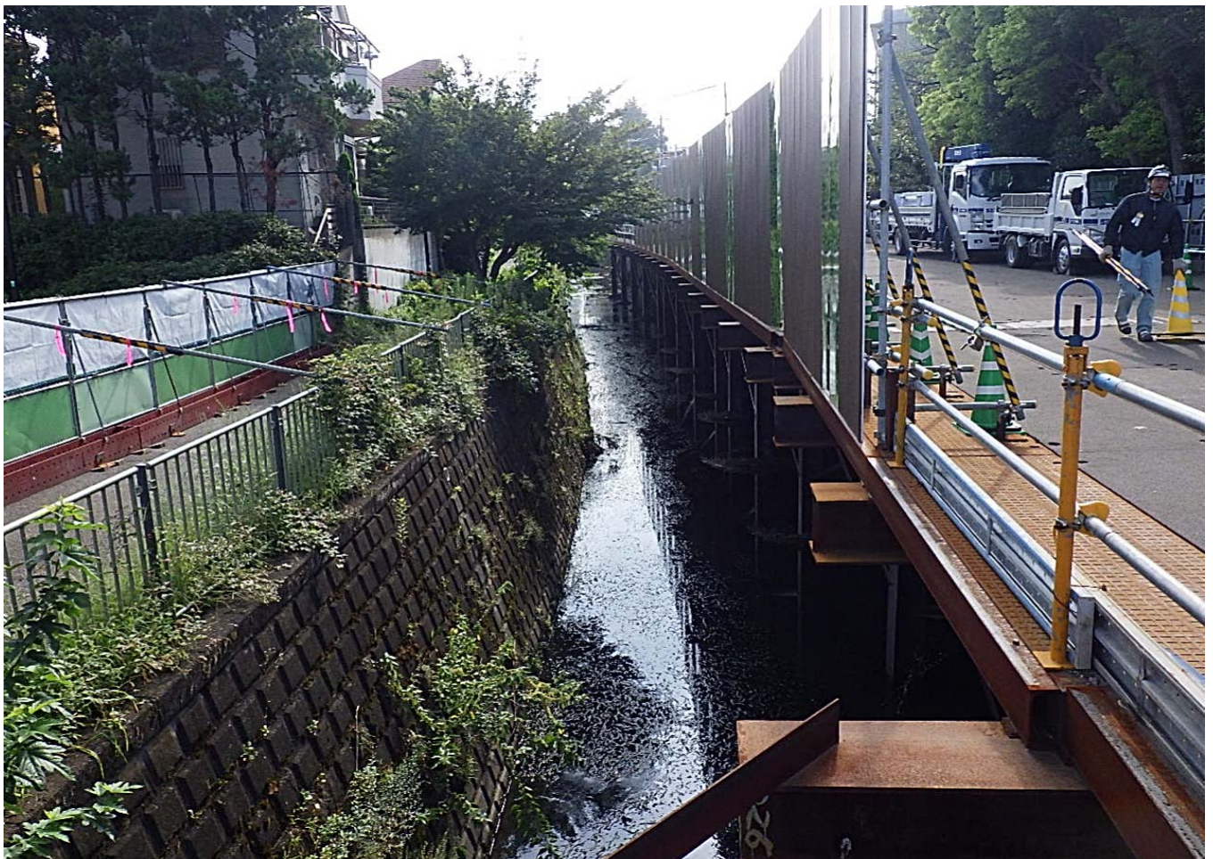
永福橋側：栈橋設置・護岸撤去工 91m完了