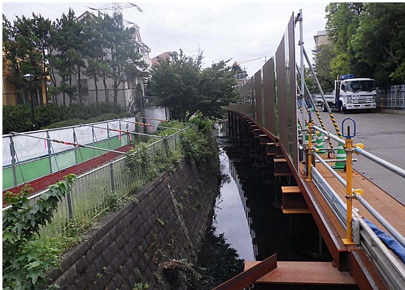
永福橋側：栈橋設置・護岸撤去工 94m完了