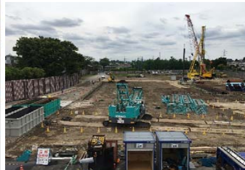
地中連続壁工 2号機 解体搬出状況