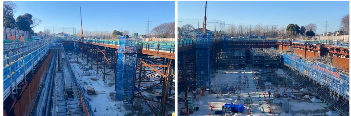
調節池ヤード 全景