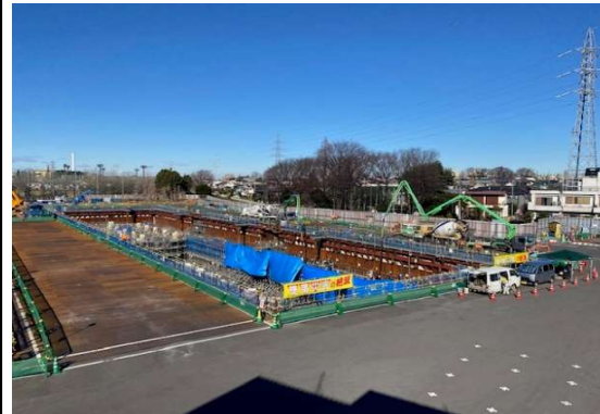
調節池ヤード 全景