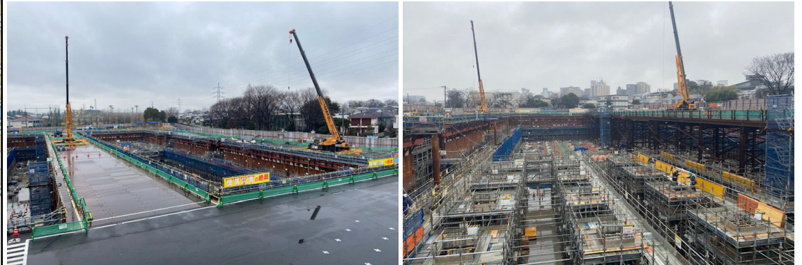
調節池ヤード 全景