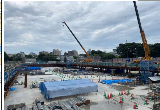
調節池ヤード 全景