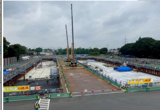
調節池ヤード 全景