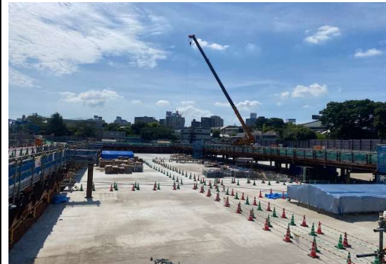
調節池ヤード 全景