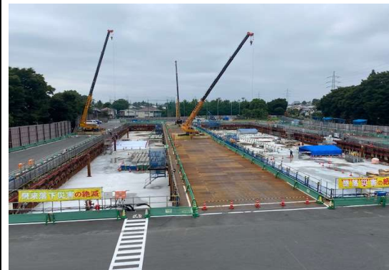
調節池ヤード 全景