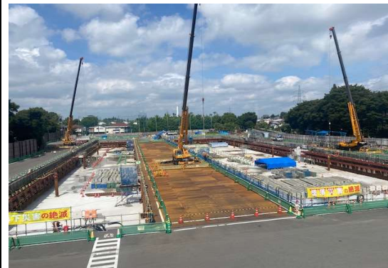
調節池ヤード 全景