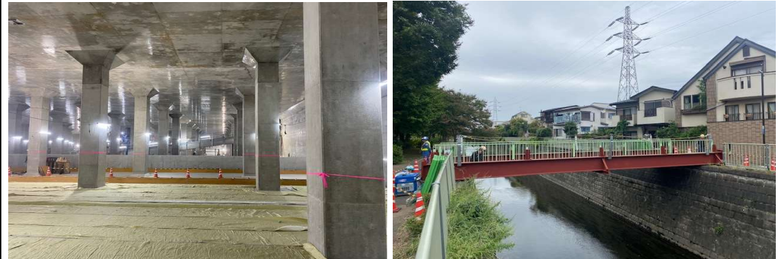
調節池ヤード 全景